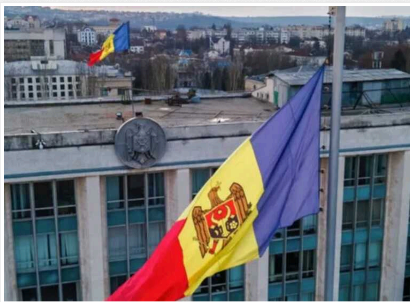
У Молдові кандидати у президенти складатимуть обов'язковий тест на знання державної мови

У жовтні 2024 року у Молдові пройдуть чергові вибори президента. Очі очі позмагатися за посаду вперше за історію країни будуть змушені довести, що повноцінно володіють румунською мовою.