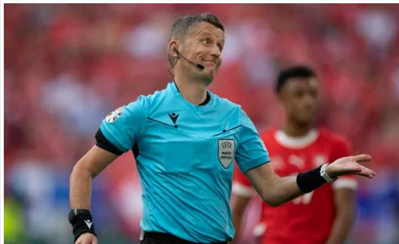
Знаменитий італійський рефері попрацював у РФ два дні та звільнився

Знаменитий італійський рефері Даніеле Орсато пропрацював у Росії лише 2 дні. 48-річний уродженець Віченці, який входить до топ-20 футбольних арбітрів Європи, залишив склад експертно-суддівської комісії Російського футбольного союзу (ЕСК РФС).