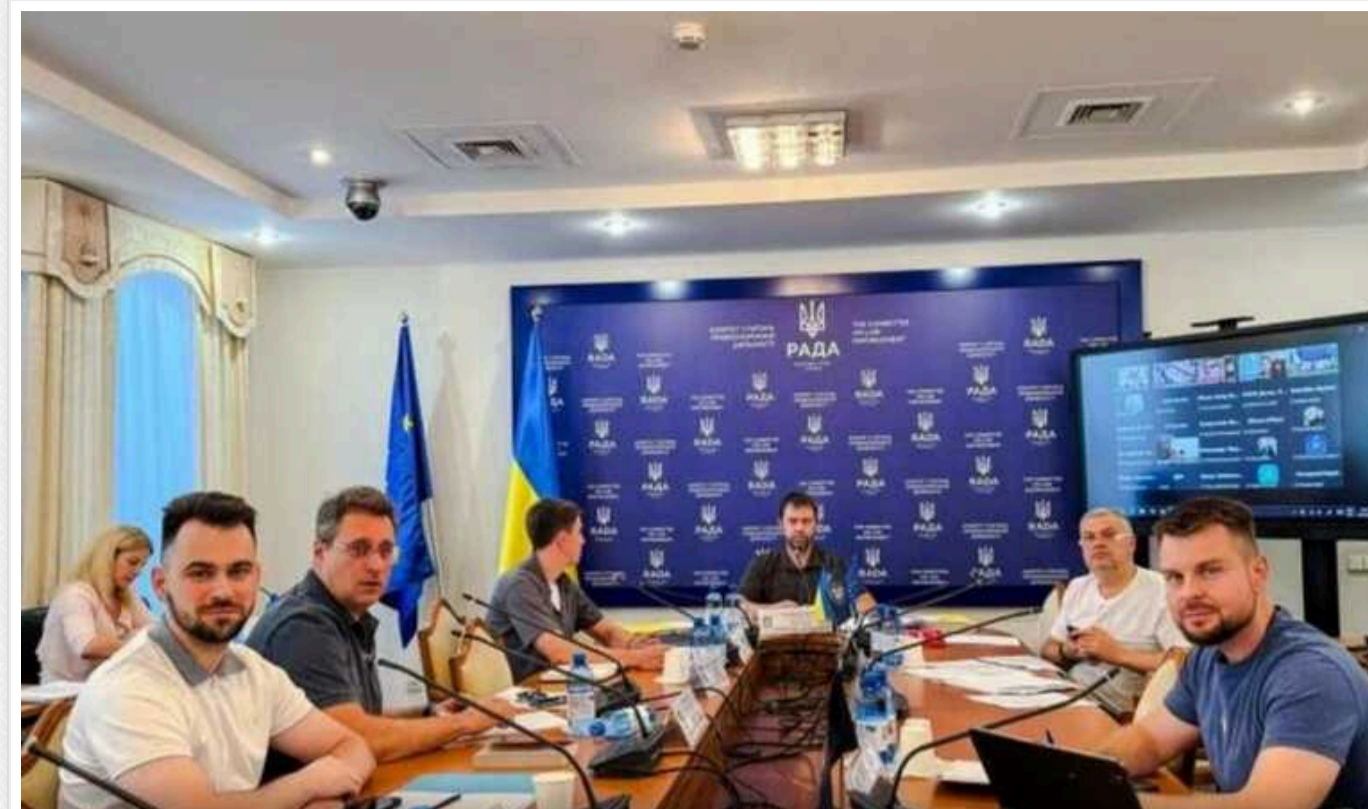
Комітет Ради рекомендував прийняти закон про позбавлення державних нагород зрадників

Правоохоронний комітет ВР Ради рекомендував ухвалити законопроекти щодо позбавлення держнагород за пропаганду агресора та вдосконалення порядку поводження зі зброєю.