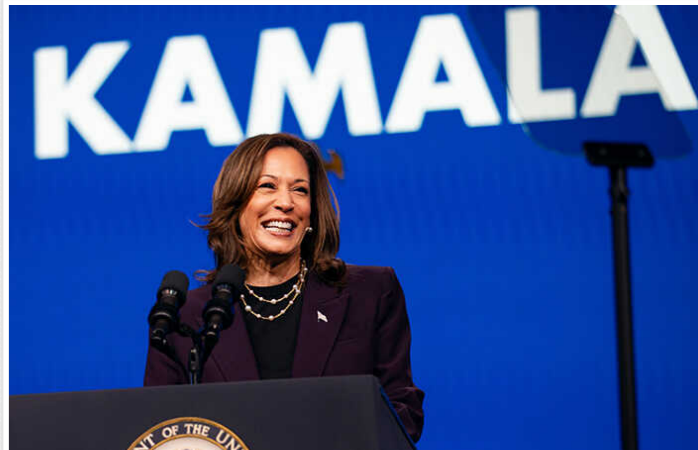
Гарріс погодилась на два раунди дебатів із Трампом

Кампанія кандидатки в президенти США від Демократичної партії Камали Гарріс заявила, що та візьме участь у двох дебатах із республіканським опонентом Дональдом Трампом.