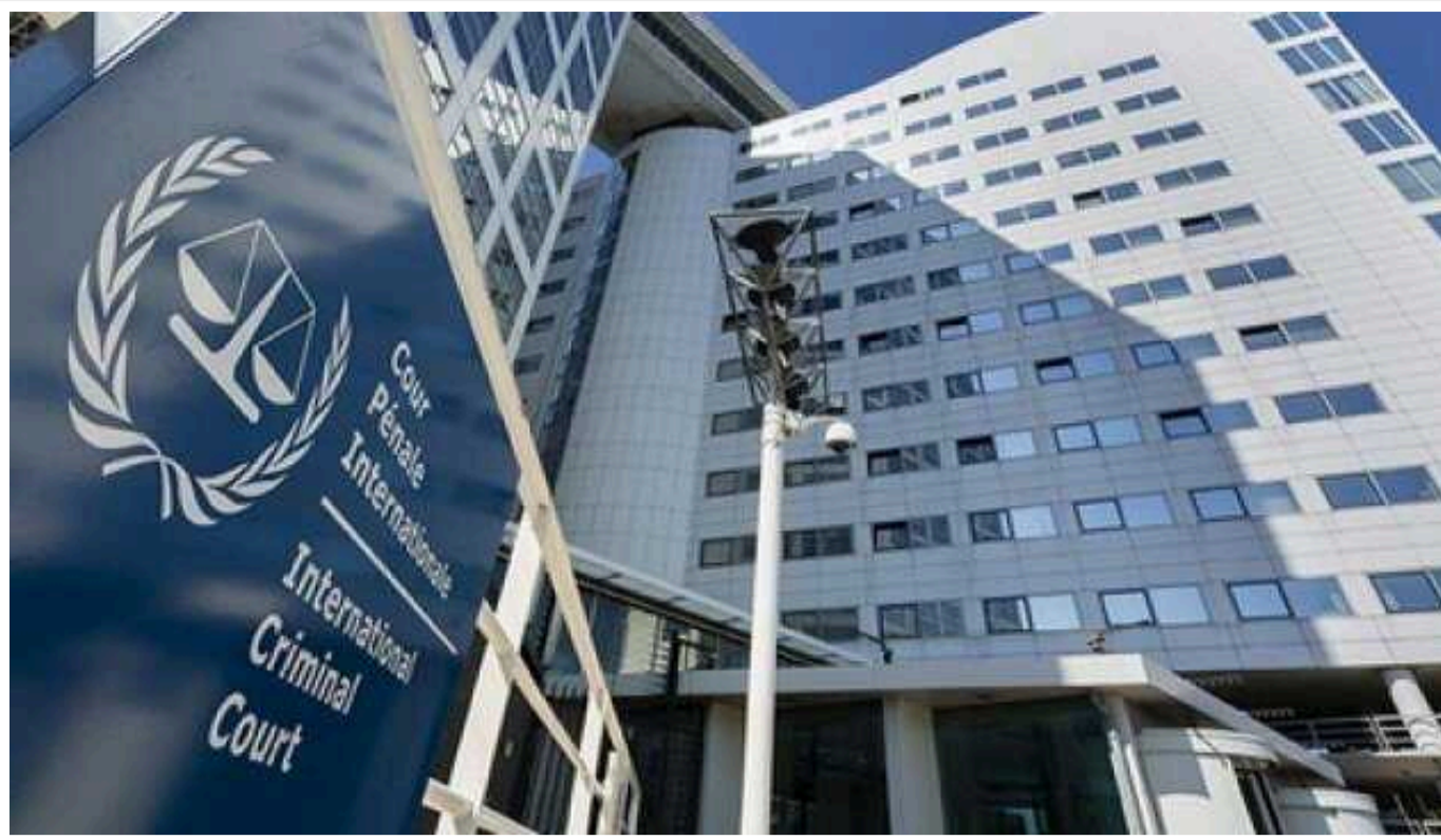
У Зеленського пояснили необхідність ратифікації Римського статуту МКС

Заступниця голови Офісу президента Ірина Мудра заявила, що ратифікація Римського статуту Міжнародного кримінального суду дасть Україні більше інструментів для притягнення до відповідальності російських воєнних злочинців.