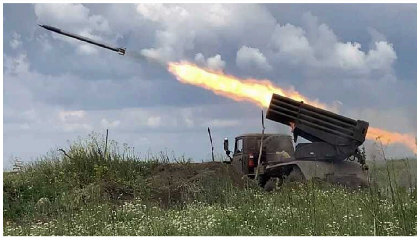
Ситуація на фронті: від початку доби відбулося вже 68 бойових зіткнень

На фронті від початку доби відбулося вже 68 бойових зіткнень з російськими військами.