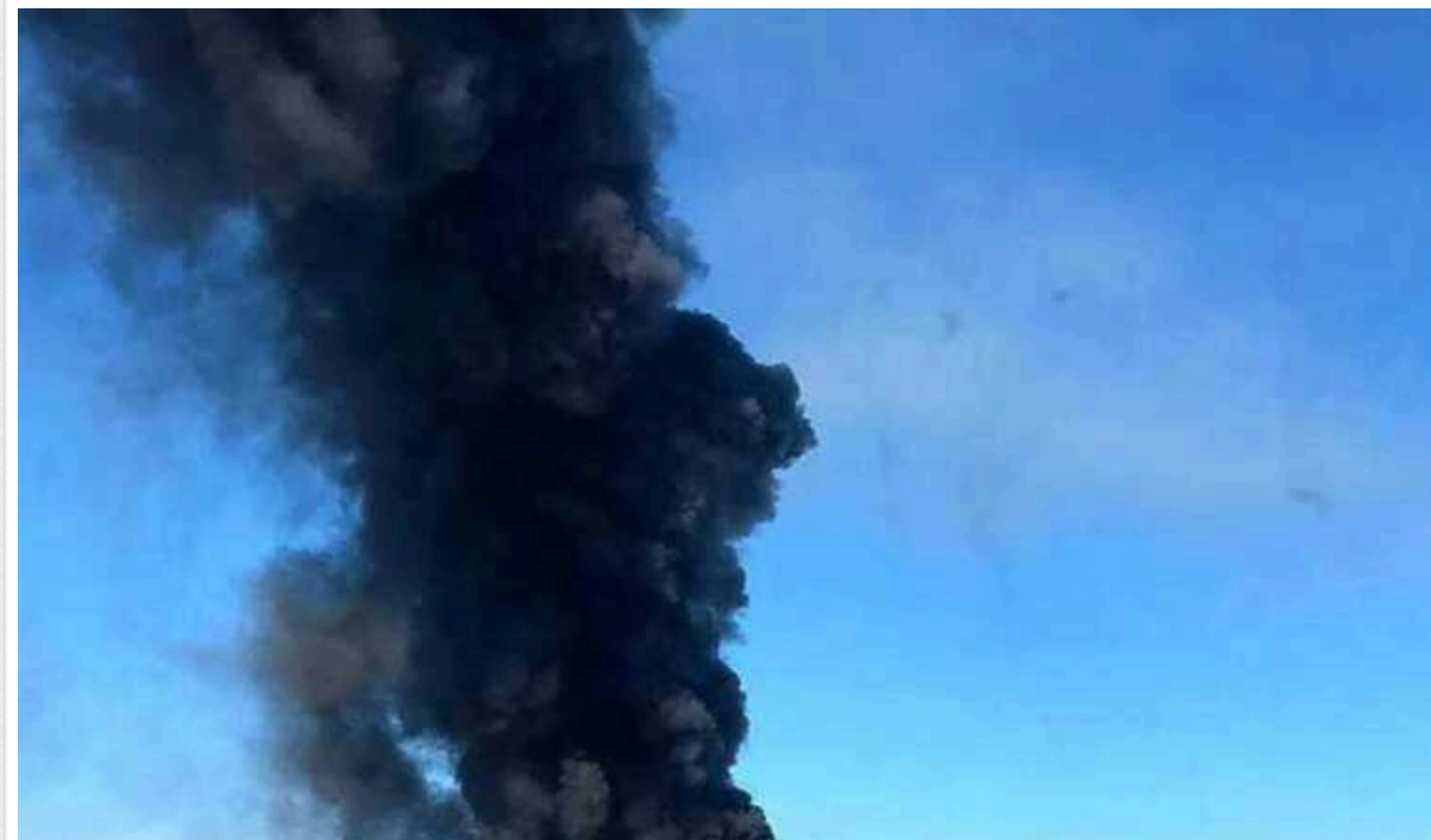
Росіяни вдарили КАБами по цивільному підприємству в Куп'янському районі

Про це повідомив голова Харківської ОВА Олег Синегубов.