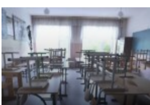
Масовий виїзд майбутнього покоління: в ефірі каналу "Акценти" попередили про...