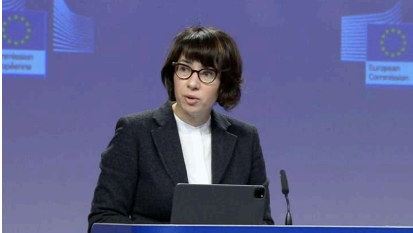
Фото: Аніта Хіппер

Євросоюз викликав тимчасового повіреного у справах рф після останніх погроз росії перейти до системних ударів по Києву. Про це йдеться в заяві речниці Єврокомісії Аніти Хіппер у соцмережі X.