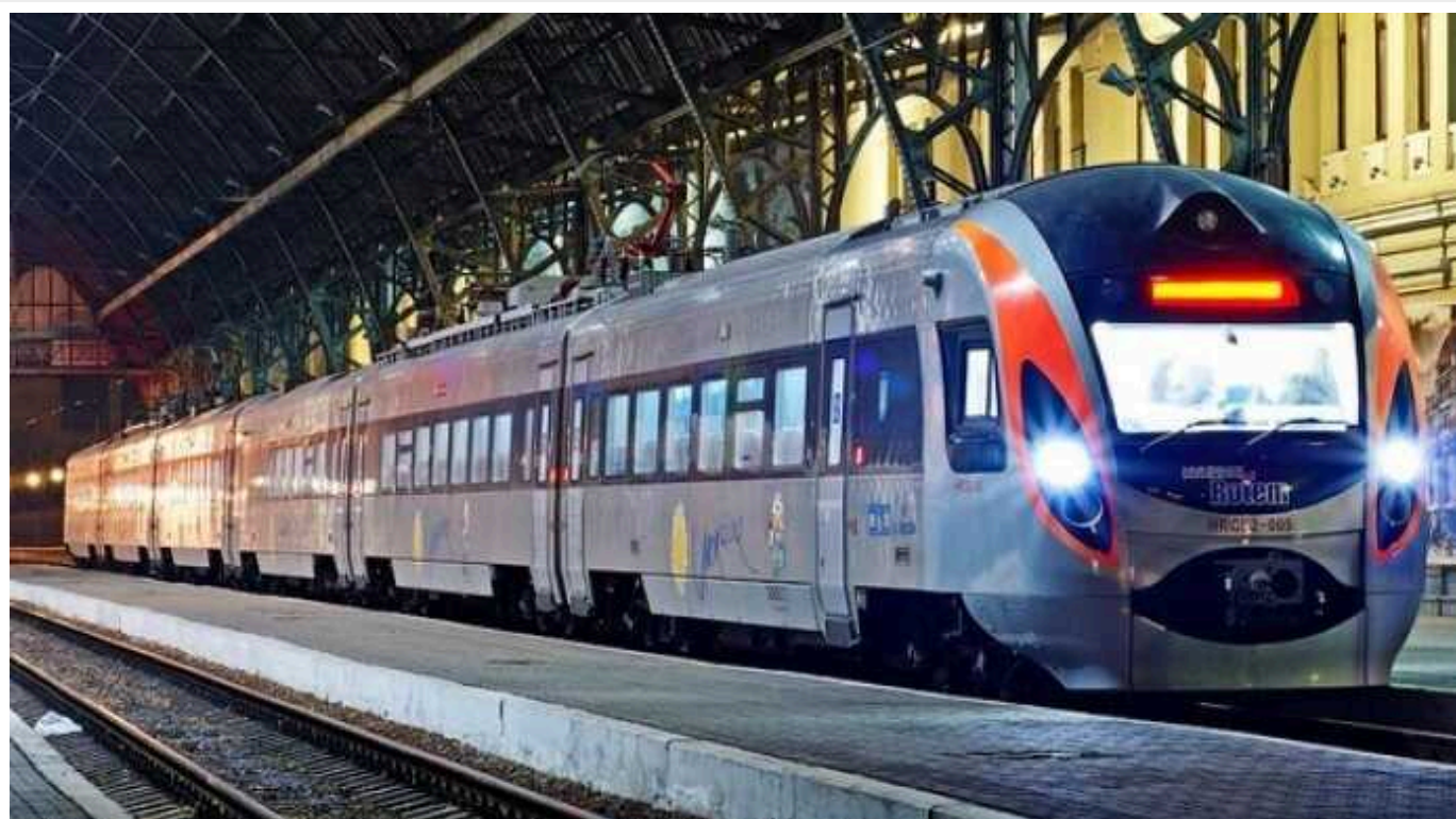
"Укрзалізниця" хоче підняти ціни на люкс та "Інтерсіті"

"УЗ" пропонує прив'язати ціни на квитки до популярності рейсів та часу доби.