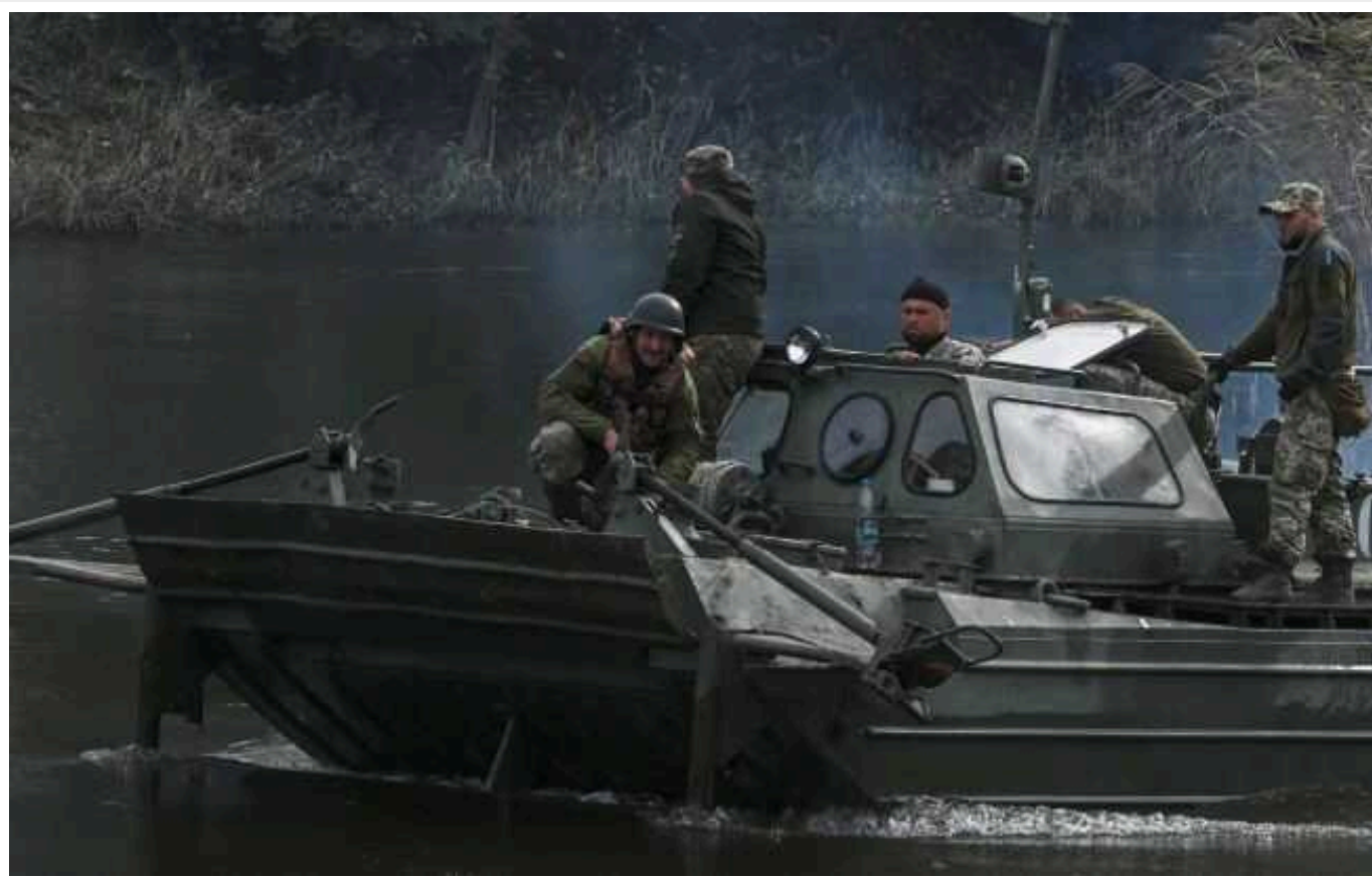
Окупанти активізувалися в районі Кринок, – речник ЗСУ

У зоні відповідальності оперативного угруповання військ "Таврія" упродовж минулої доби було відбито 10 російських штурмових дій. Ворог активізувався на лівому березі Дніпра в Херсонській області.