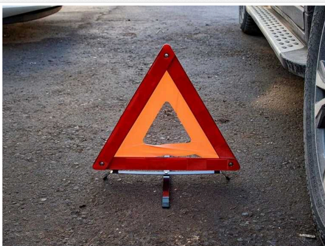
У Кропивницькому водій уник за смертельну ДТП: його адвокат — колишній суддя