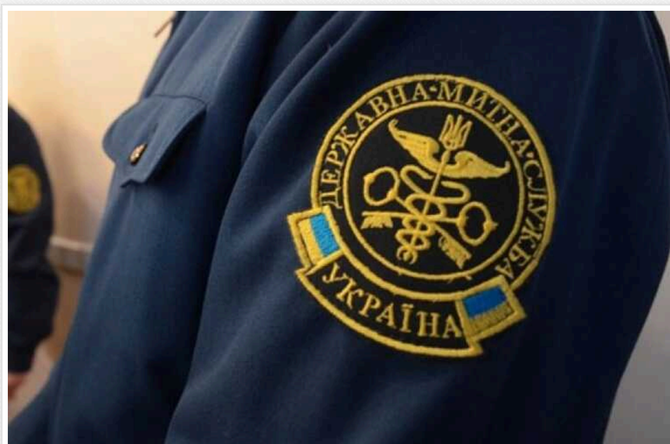
Митна "Коза Ностра" України: як боротися з корупцією на митниці

Корупція на українських митницях є одним із найгостріших і системних викликів для держави. Незаконні побори, що беруться з кожного транспортного засобу, який перетинає кордон, стали звичною практикою, перетворивши митні органи на своєрідну мафіозну структуру.