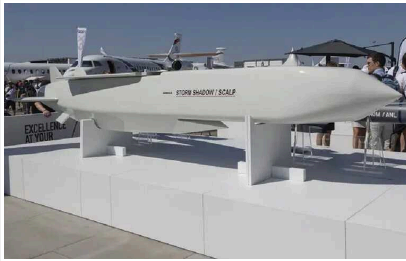
Британія закликає дозволити Україні удари Storm Shadow по російській території, – The Times

The Times, із посиланням на джерела, повідомляє, що Британія закликає союзників дозволити Україні удари Storm Shadow по території РФ.