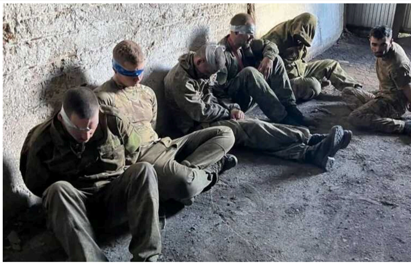
На Курщині спецпризначенці СБУ взяли в полон 102 військових РФ: зокрема кадировців із «Ахмата»

У Курській області РФ українські спецпризначенці взяли в полон одразу 102 російських військовослужбовців. Серед них виявилися і найманці так званого кадировського спецназу "Ахмат".