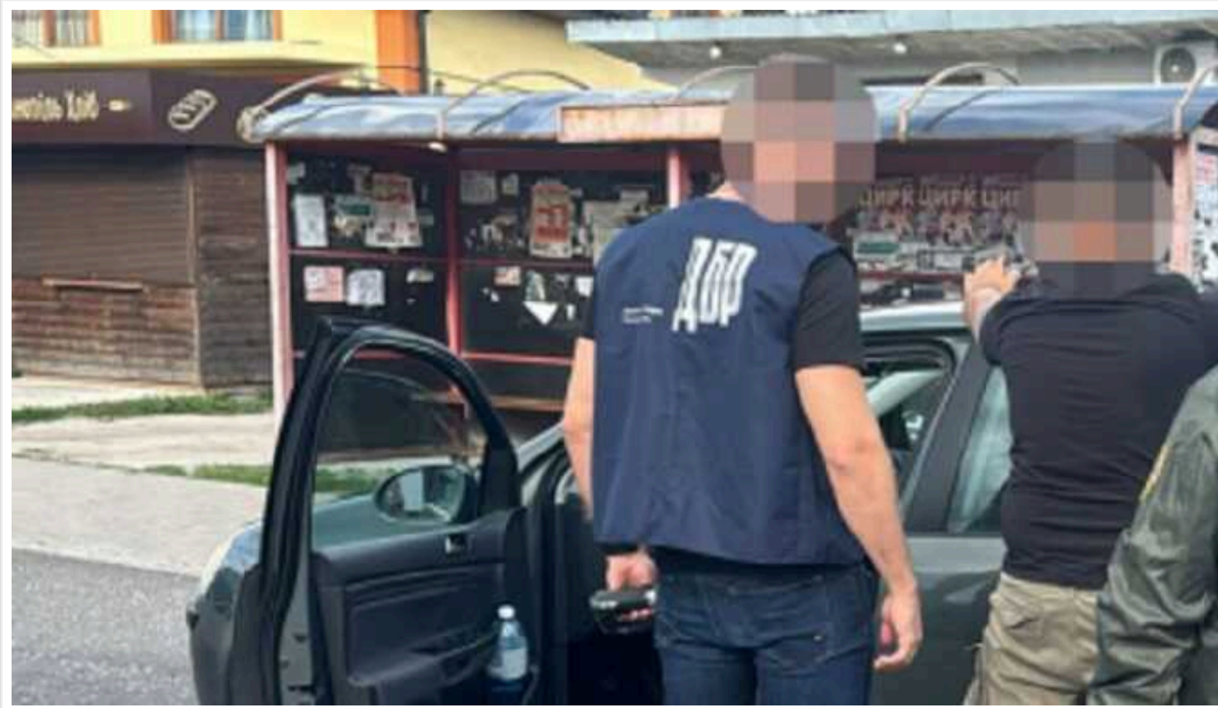
На Львівщині посадовця кінологічного центру затримали за переправлення ухилиянта

Прикордонник за 21 тис. євро обіцяв переправити військовозобов'язаного до Європи.