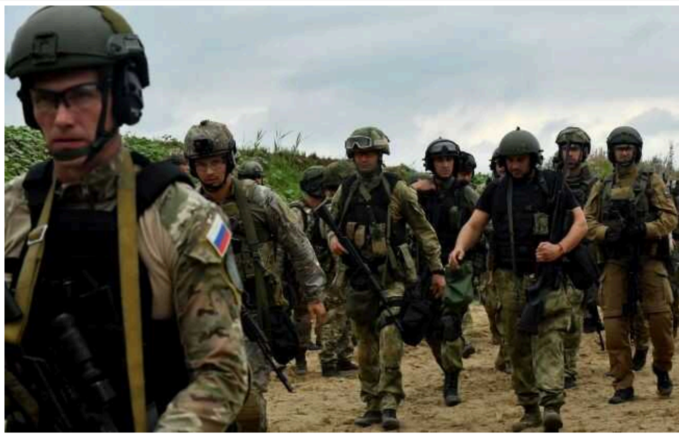
Окупанти проводять перегрупування та підготовку до нових штурмів на Харківському напрямку

Обстановка на Харківському напрямку залишається складною. Російські окупаційні війська не припиняють спроб прорвати оборону українських військ, здійснюючи інтенсивні обстріли позицій наших захисників на всіх активних ділянках фронту.