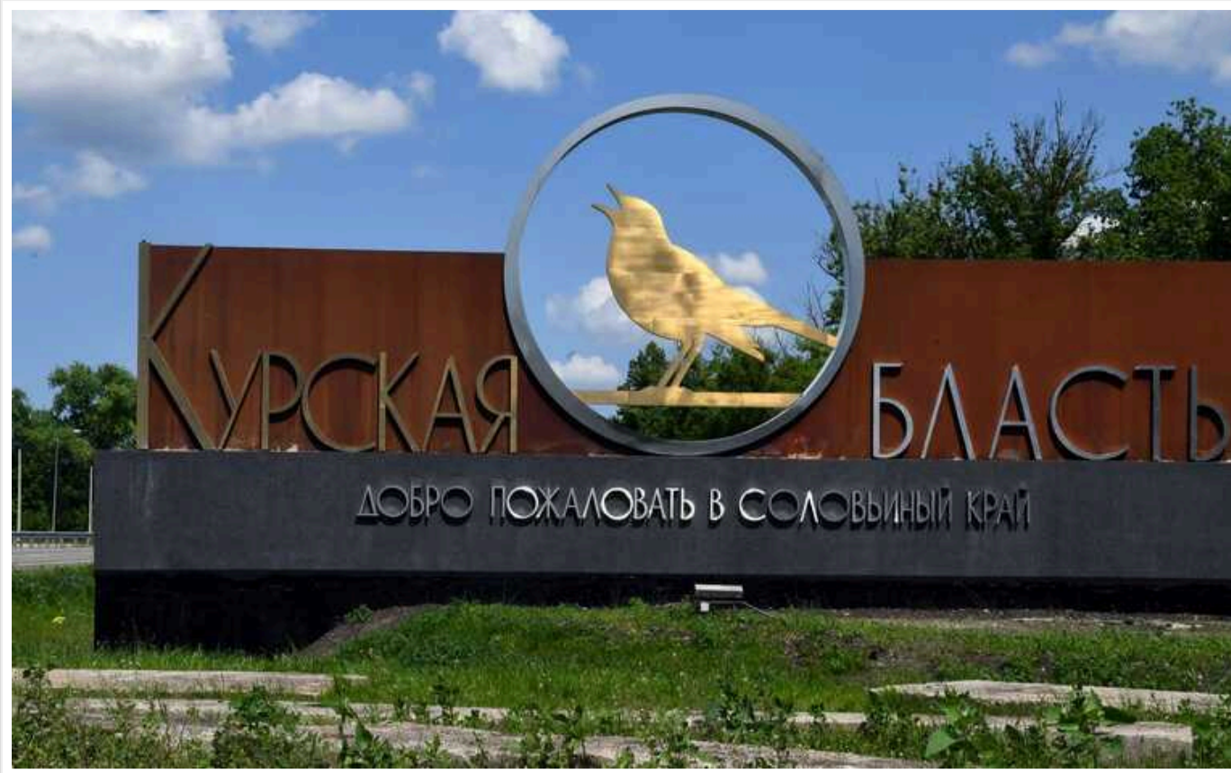
У Курській області рота солдатів РФ здалась у полон: більше сотні росіян добровільно склали зброю

Українські військові у Курській області взяли у полон понад сотню російських солдатів. Рота прийняла таке рішення після того, як військове керівництво покинуло їх напризволяще.