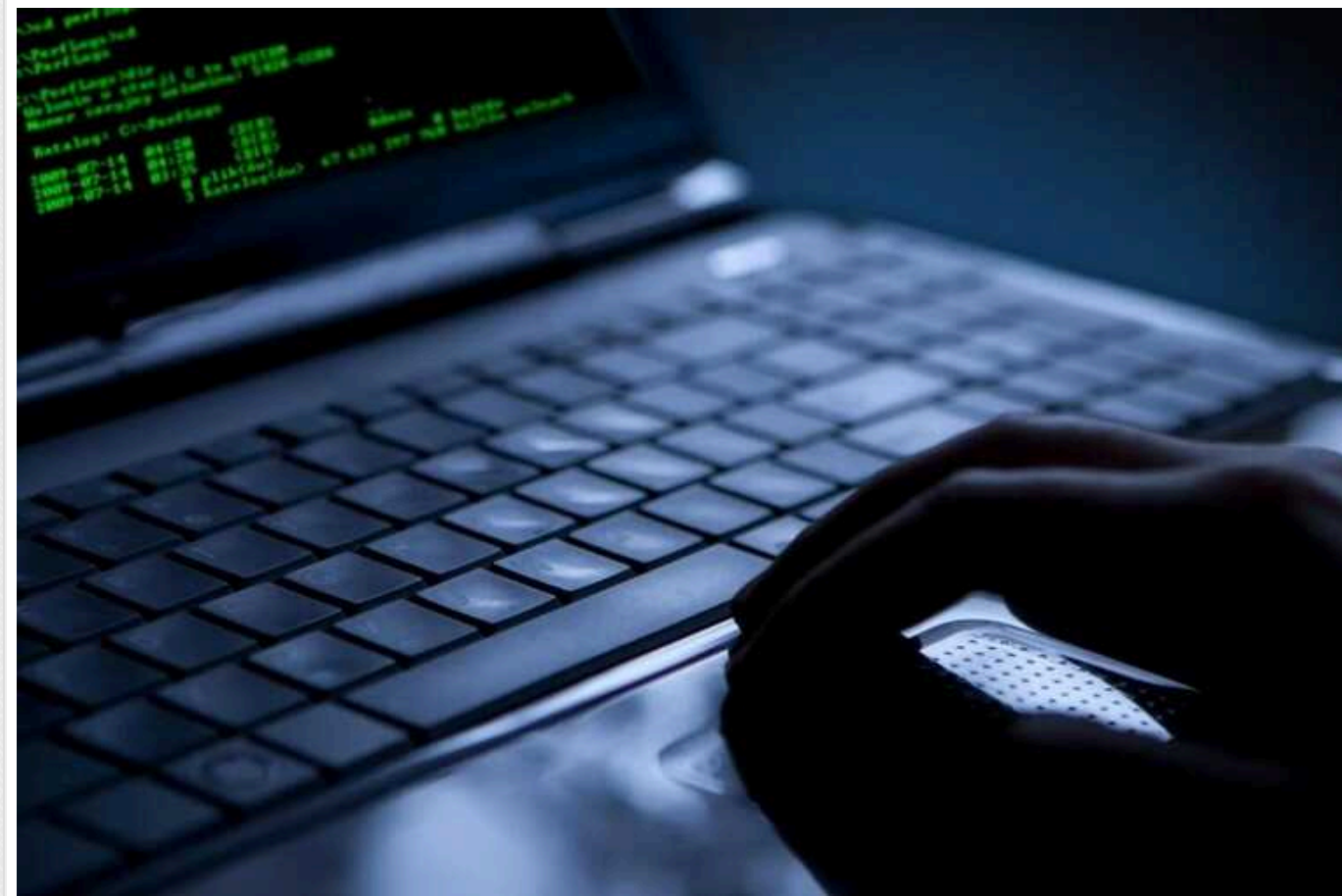
Bloomberg: Російські хакери намагалися атакувати експосла США в Україні

Хакери, пов'язані з Кремлем, намагалися атакувати колишнього посла США в Україні Стівена Пайфера. Вони хотіли зламати його електронну пошту.