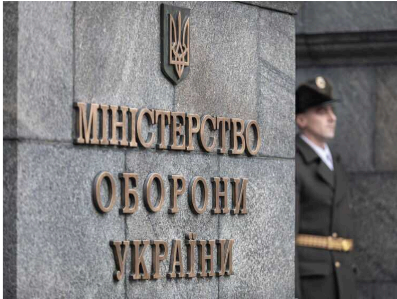
У Міноборони підтримали проєкт про відстрочку від мобілізації для чоловіків, у яких на війні загинув неповнорідний брат

Комітет з нацбезпеки незабаром розгляне законопроект щодо заборони мобілізувати другого сина у матері, якщо він є братом загиблого, але від іншого батька.