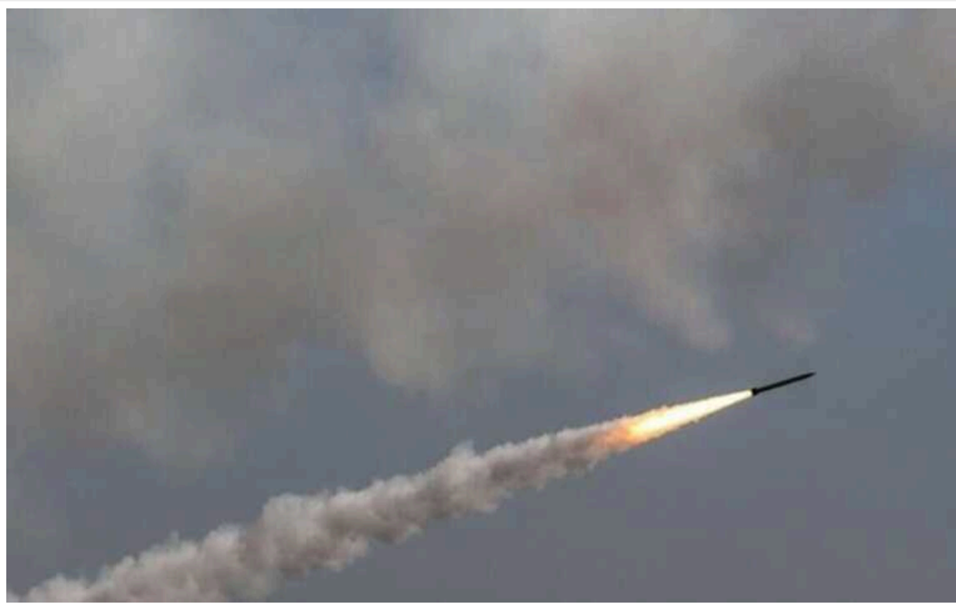
Росія вдарила по Одесі балістикою