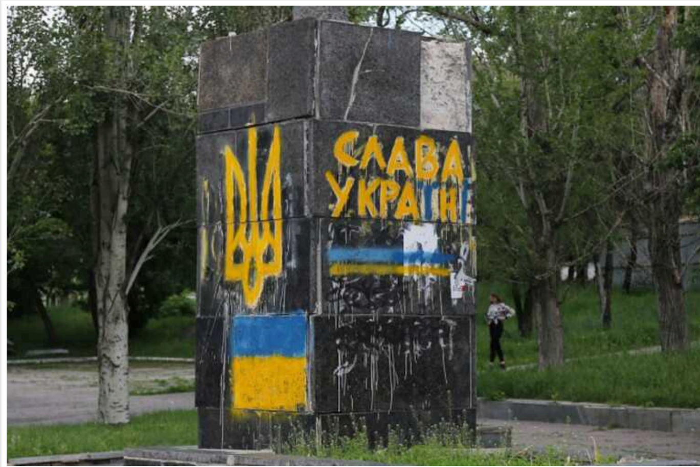
У Торецьку Донецької області залишаються близько 3000 осіб, які не поспішають евакуюватися

Про це заявив в ефірі телемарафону голова ОВА Вадим Філашкін, назвавши ситуацію в місті "дуже складною".