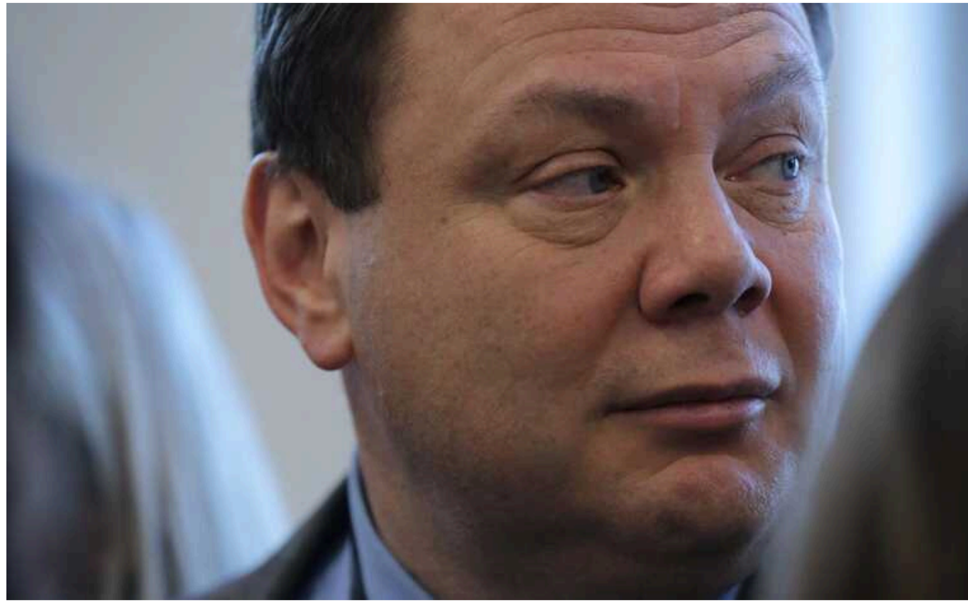
Російський олігарх Фрідман вимагає від Люксембургу 16 мільярдів доларів за "несправедливі" санкції

Російський мільярдер Михайло Фрідман подав позов до Гонконзького арбітражного центру проти Люксембургу, вимагаючи 16 мільярдів доларів компенсації за заморожені активи, які, на його думку, були незаконно експропрійовані через санкції ЄС. Фрідман стверджує, що ці дії порушують інвестиційний договір 1989 року, і розглядає подальше звернення до міжнародних судових інстанцій.