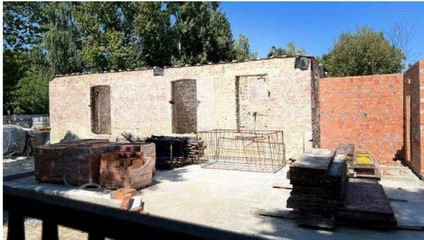
Львівська поліція розслідує самовільне будівництво компанією Дубневича в центрі міста

Львівська мерія виявила самовільне будівництво на території парку «Цитадель».