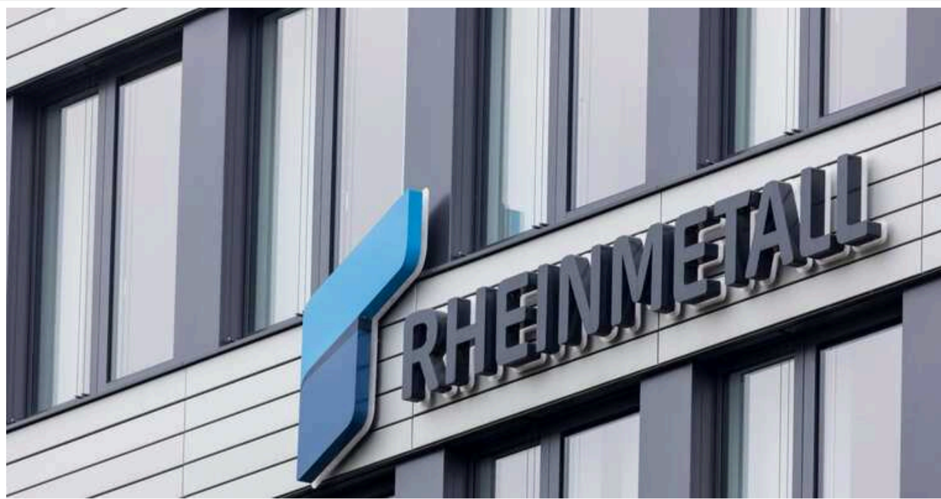
Німецький Rheinmetall купує американську Los Performance Products

Найбільший німецький виробник зброї Rheinmetall планує придбати американську компанію Los Performance Products, LLC.