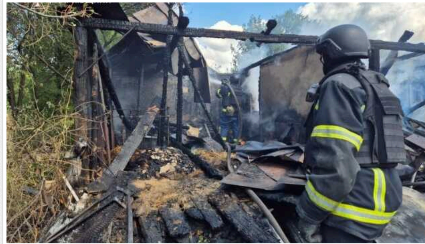
Окупанти на Харківщині повторно вдарили по місцю гасіння пожежі, яка виникла через обстріли

На Харківщині, у селі Кругляківка Куп'янського району, ворог завдав повторних ударів по місцю гасіння пожежі, яка виникла через обстріли. Загарбники намагались поцілити у вогнеборців.