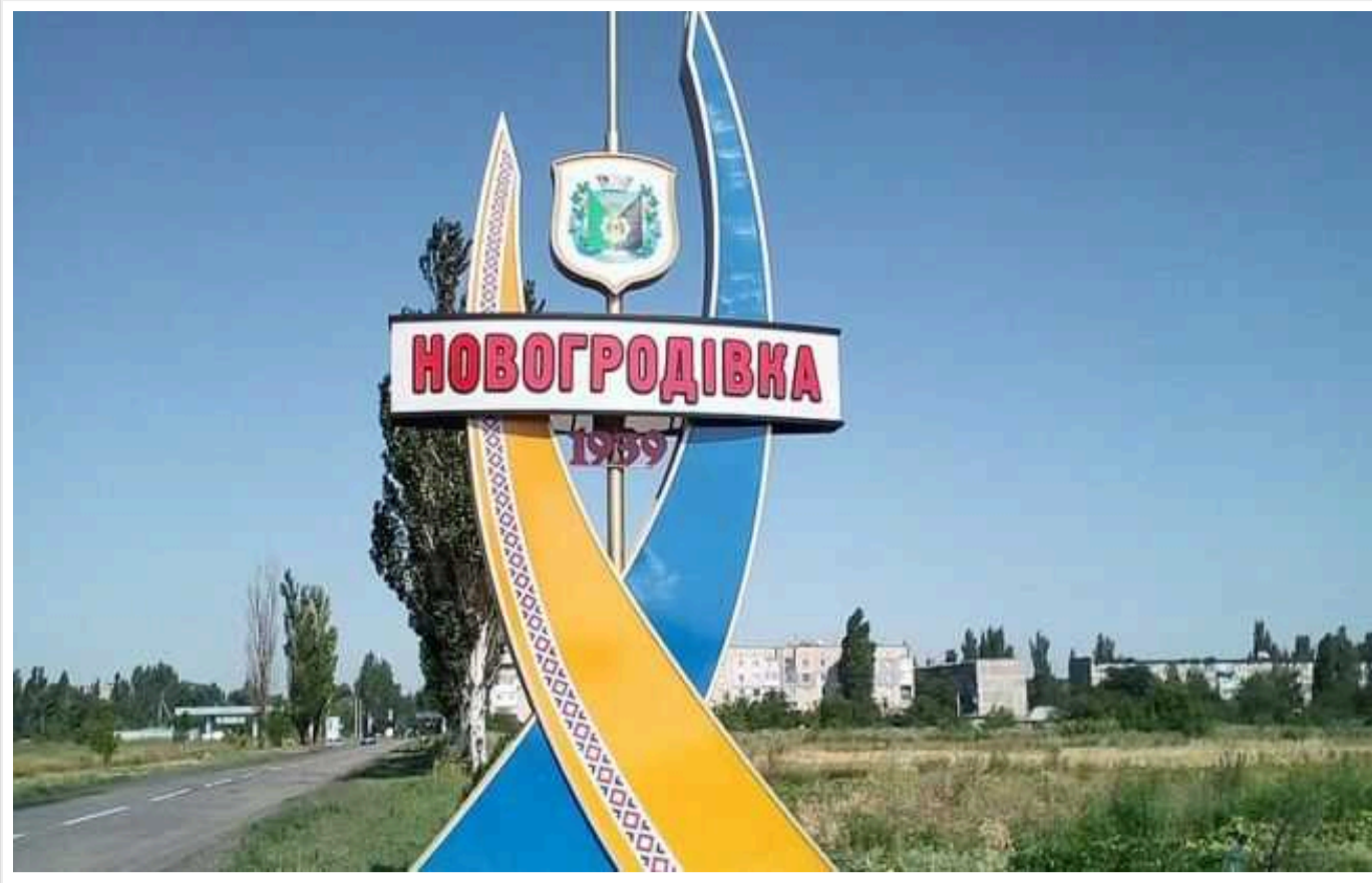
Під Покровськом у місті Новогродівка ввели майже цілодобову комендантську годину

У місті Новогродівка Донецької області комендантська година діятиме 20 годин на добу. Такі правила набудуть чинності відзавтра.