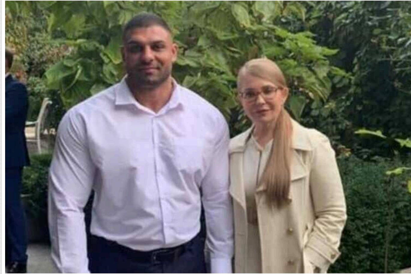
Нова справа для Юлії Тимошенко: ЗМІ звинуватили лідерку БЮТ у сприянні діяльності бандформування

Лідерка партії «Батьківщина» Юлія Тимошенко має безпосередній вплив на кримінальну діяльність відомого в Одеській області бандформування "Самсонів". Голова формування Андрій Бабенко навіть входить до її партії, пише "Парламент".