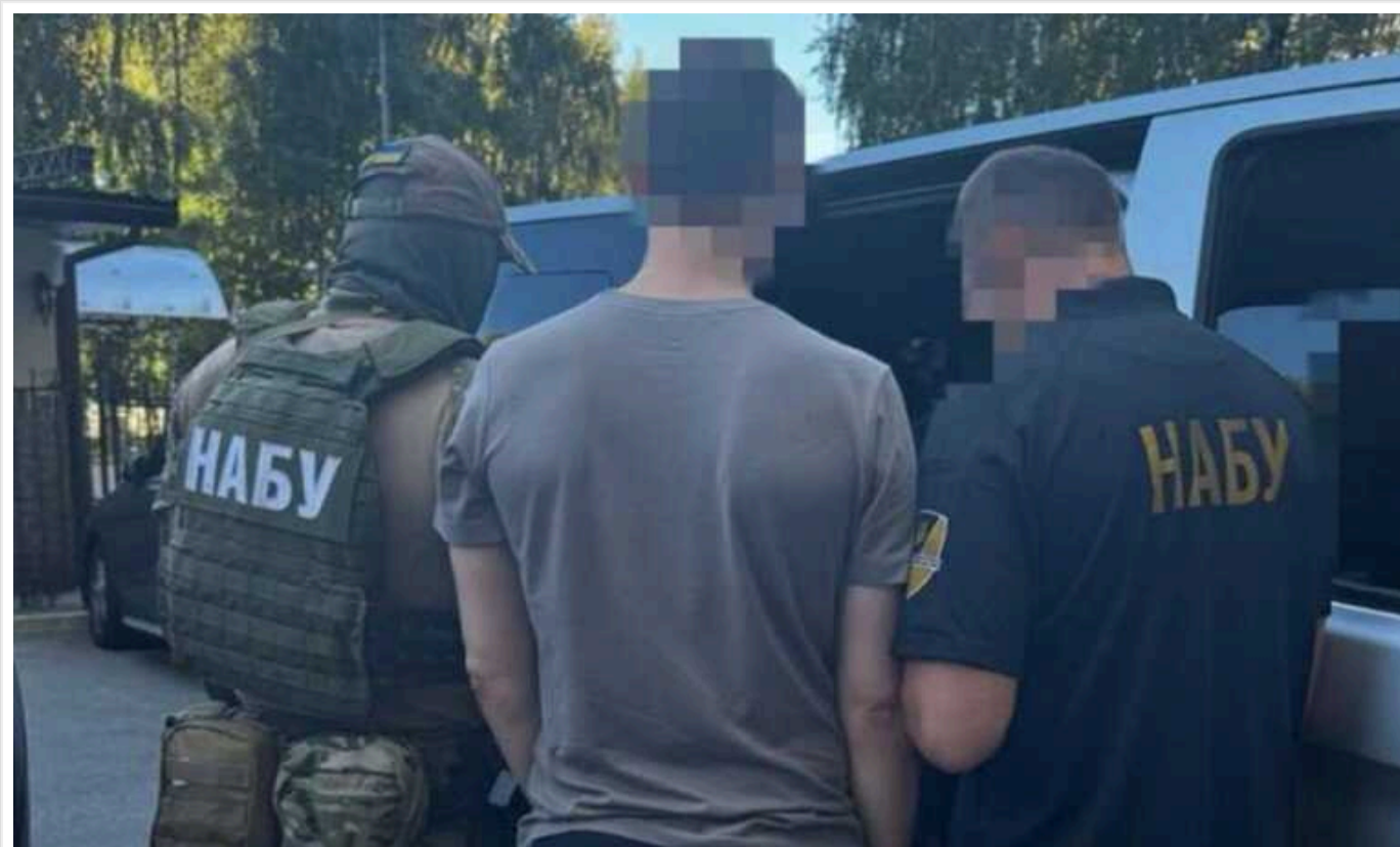
НАБУ та САП викрили масштабну схему розкрадання під час закупівлі обладнання для «Харківобленерго»

НАБУ і САП затримали двох співorganizаторів злочинної схеми із заволодіння понад 12,5 млн грн та замаху на заволодіння ще 120 млн грн під час закупівлі трансформаторного та вимірювального обладнання АТ «Харківобленерго».