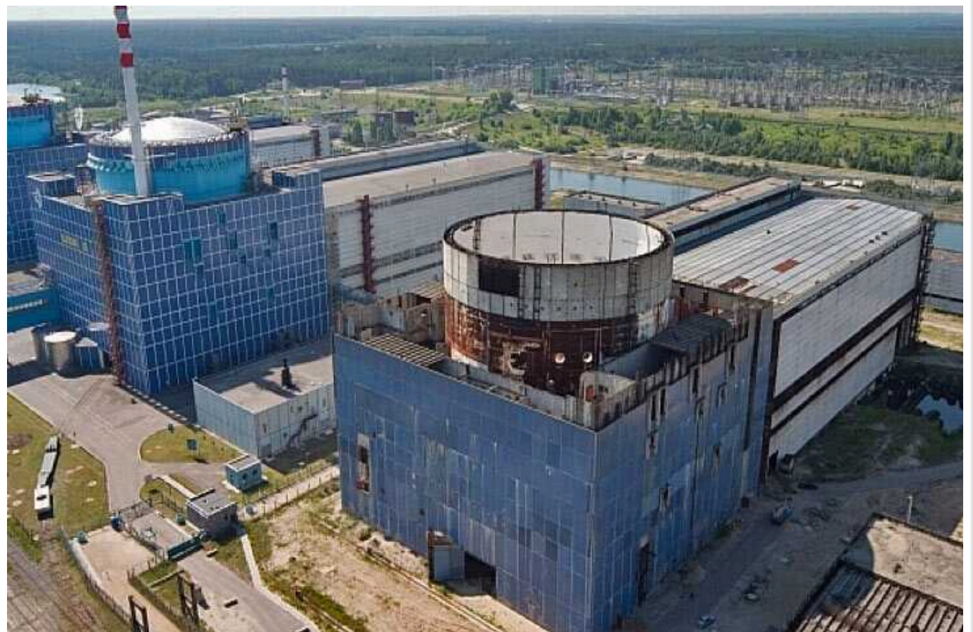
Невмолима потреба у «великому атомному будівництві»: «Великі заробітчани» покладають неабиякі сподівання

Після повномасштабного вторгнення схема корупційних заробітків в Україні зазнала певної трансформції. Асфальтна марка «Великого будівництва» перестала конвертуватися у «чорні» зарплати провадних функціонерів, бо припишили масштабні ремонтні дарі, а ті, що залишилися, — мізерні порівняно з довоєнними часами.