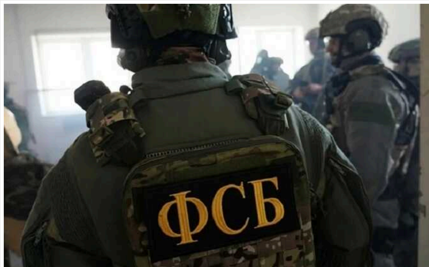
Що відомо про потенційного очільника ФСБ Сергія Корольова: «вовкодав Путіна», який має зв'язки з російською мафією

72-річного Олександра Бортнікова на посаді керівника ФСБ РФ потенційно може замінити генерал армії Сергій Корольов, який зараз є його першим заступником. На офіційних посадах ФСБшник служить державі-агресору понад 20 років, має широкі повноваження, пов'язаний з агресією проти України, а також – образу з кількома лідерами кримінального світу, яких звинувачували у десятках вбивств і викраденнях.