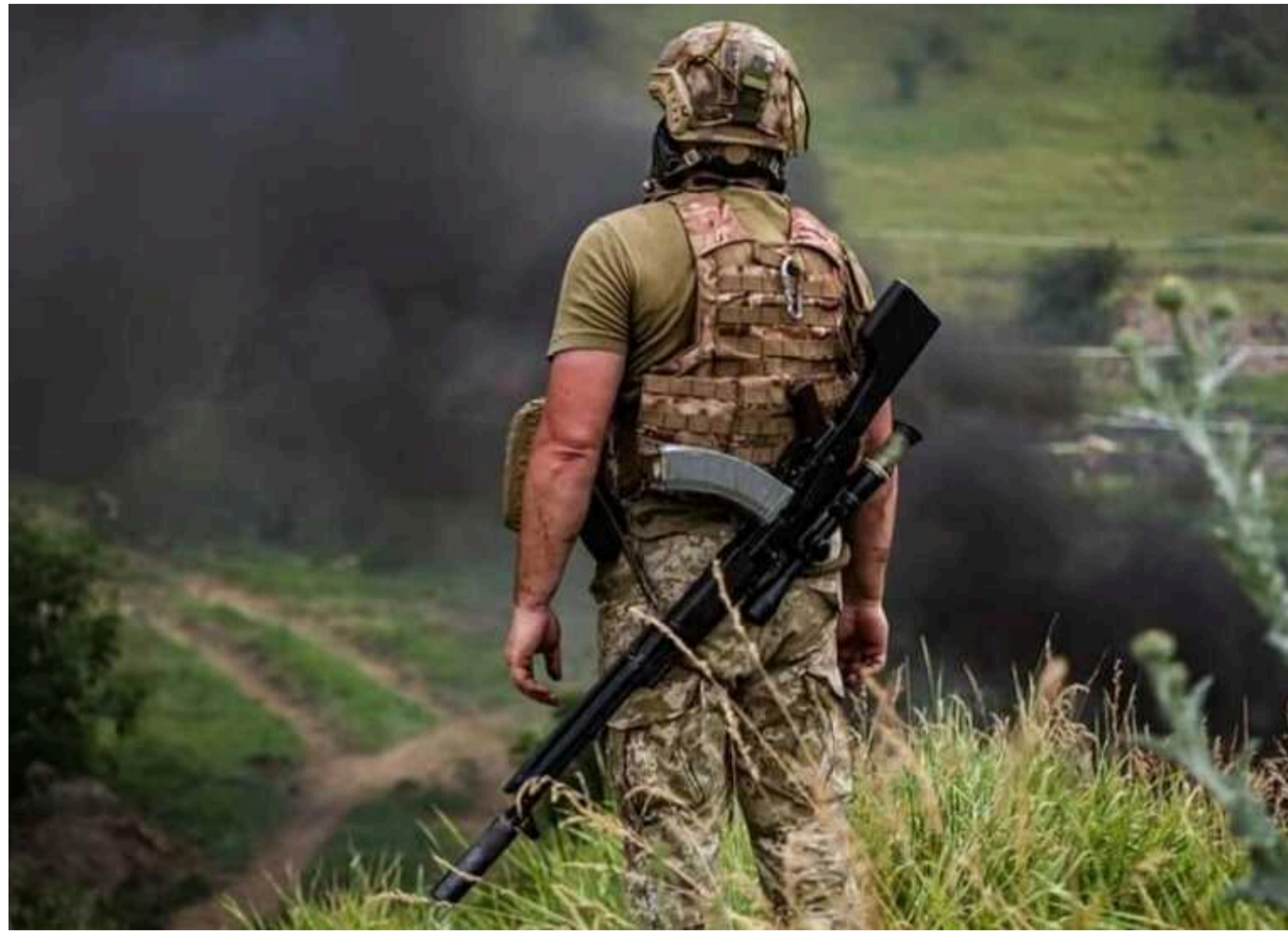
Ситуація на фронті: за добу - 111 боєзіткнень, ворог активізувався на Придніпровському напрямку

Протягом вівторка, 13 серпня, на фронті сталося 111 бойових зіткнень Сил оборони України з російськими загарбниками, 48 з них - на Покровському напрямку.