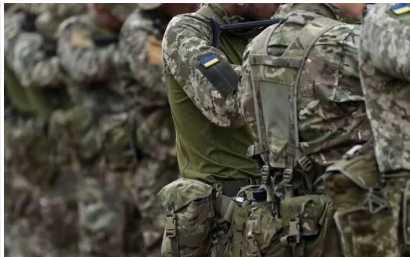
Bloomberg: Україна задумала прорив, щоб "вивести Кремль із рівноваги"

Про це пише Bloomberg із посиланням на західного чиновника.