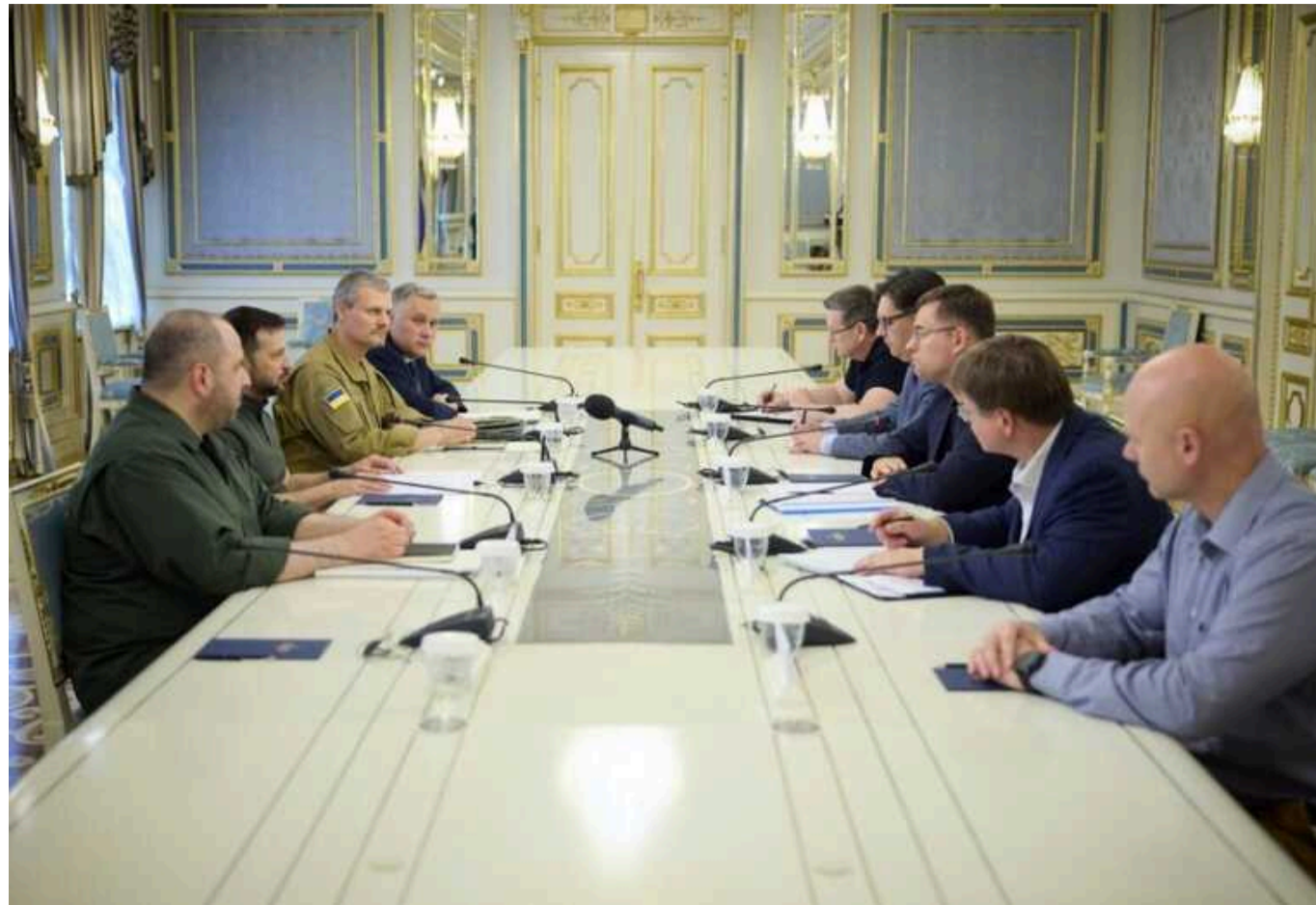
До Києва з неоголошеним візитом прибув міністр оборони Литви та зустрівся із Зеленським

Литовський міністр оборони Лаурінас Кашюнас, несподівано приїхавши до Києва, у вівторок, 13 серпня, зустрівся з президентом Володимиром Зеленським.