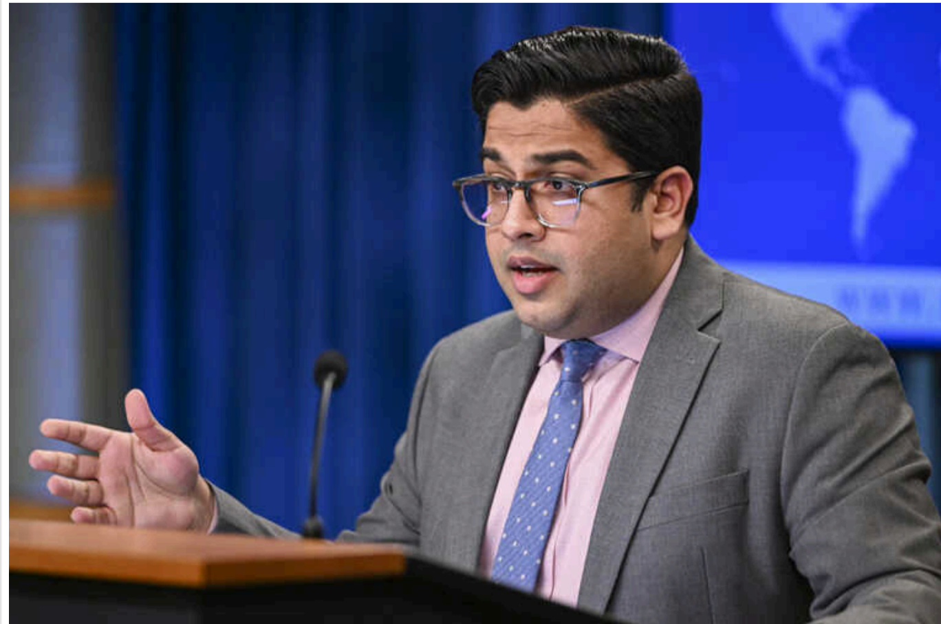
США вкотре заперечили причетність до планування операції ЗСУ в Курській області