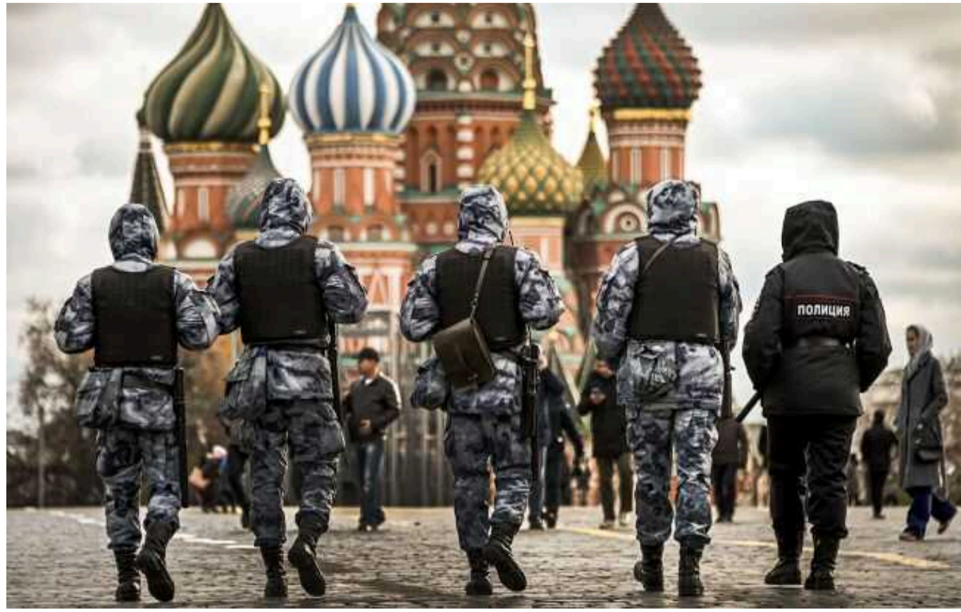
РФ може влаштувати теракт у Москві, аби звинуватити в цьому Україну, - РНБО

Росіяни заявили про посилення заходів безпеки в Москві. Це може свідчити про те, що РФ може вчинити у Москві теракт і звинуватити в цьому Україну.