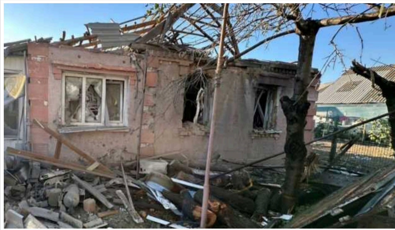
Окупанти впродовж дня обстрілювали Нікополь із «Градів» і важкої артилерії, є загиблий

Упродовж дня армія РФ атакувала територію Нікопольського району Дніпропетровщини з «Градів» і важкої артилерії, поранений 33-річний чоловік помер у лікарні.