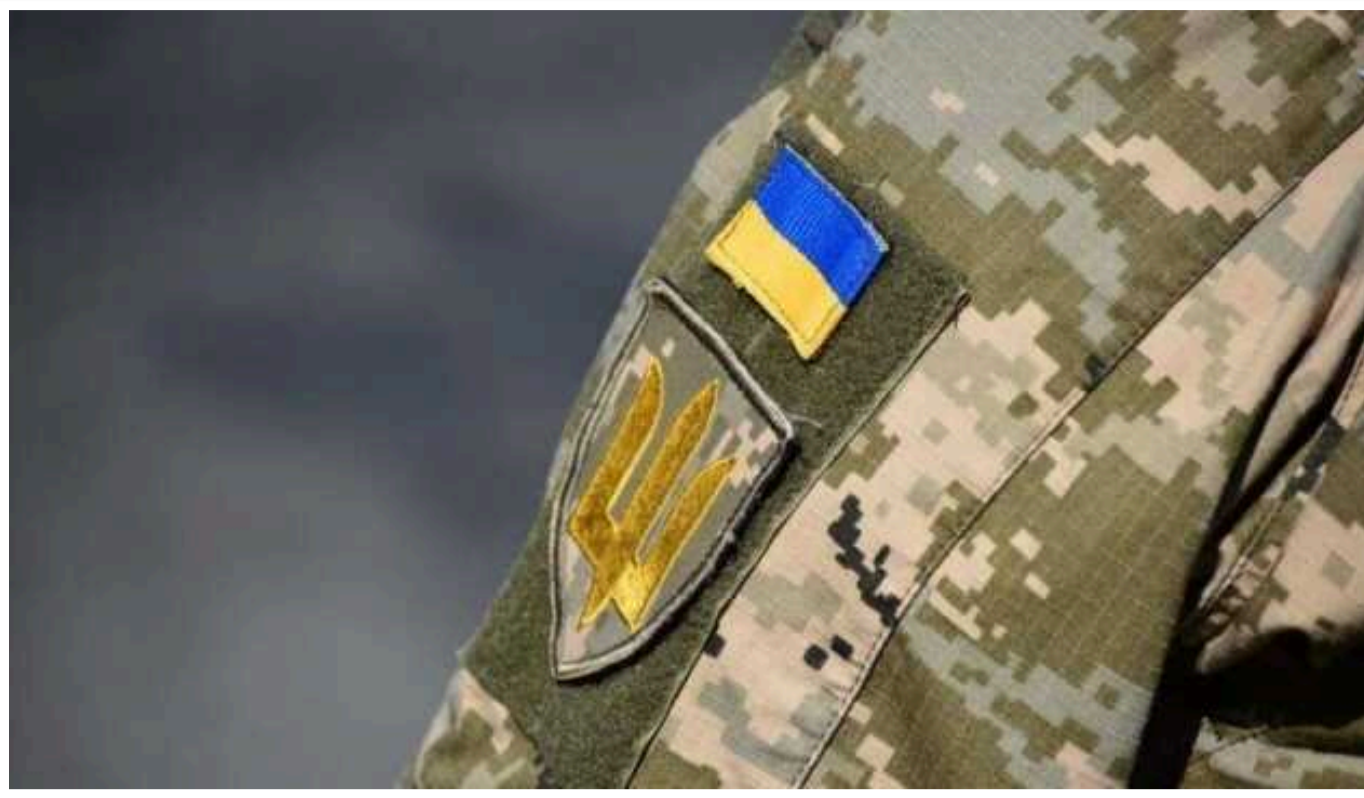
Особистим поданням заяви про відстрочку до ТЦК військовозобов'язаним вважається також направлення її поштою

Обов'язок «особисто повідомити» не означає «особисто прийти». На це вказав у своєму рішенні від 5 серпня 2024 року Тернопільський окружний адміністративний суд.