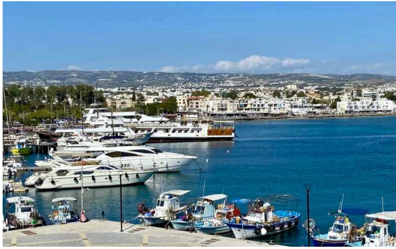
Кіпр готовий прийняти іноземців у разі ескалації між Ізраїлем і Ліваном

Кіпр завершив підготовку до потенційної евакуації іноземців з Лівану та Ізраїлю на випадок, якщо між ліванською "Хезболлою" та ізраїльськими силами спалахнуть сутички.