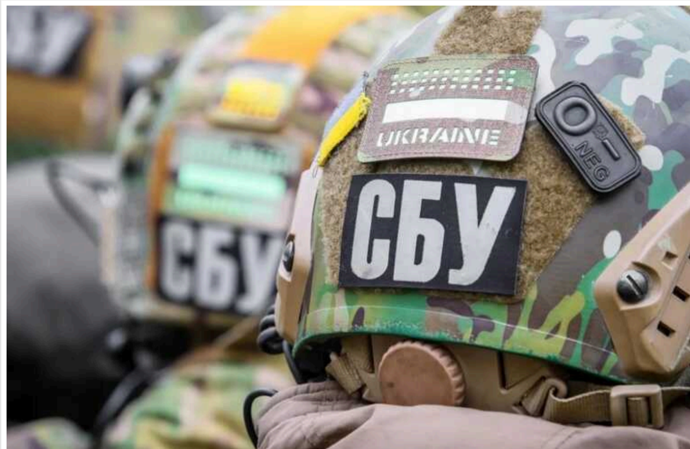
СБУ попередила про спроби РФ дискредитувати ЗСУ на тлі подій у Курській області

Служба безпеки України попереджає, що спецслужби Росії можуть використати ситуацію в Курській області для безпідставного звинувачення українських військових у вчиненні воєнних злочинів.