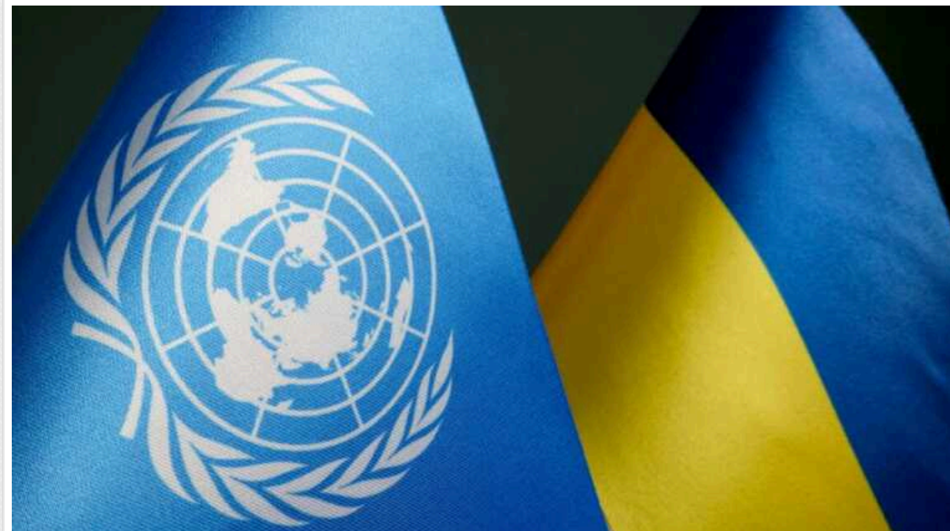
Гуманітарний план ООН для України на 2024 рік профінансовано лише на 30%, - Браун

План гуманітарного реагування місії ООН становить $3 млрд на 2024 рік, і його профінансовано лише на 30%.