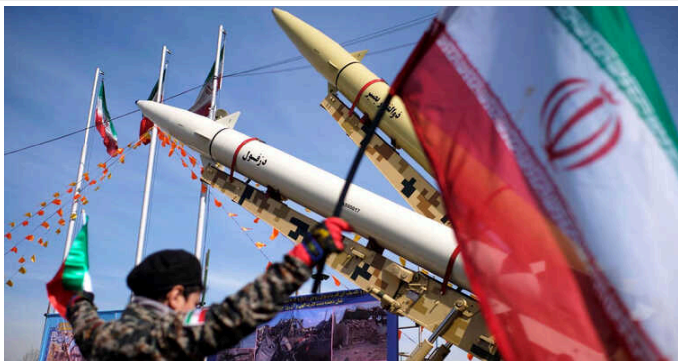
Іран може атакувати Ізраїль у найближчі 24 години, - ЗМІ

Телеканал повідомляє, що Франція, Німеччина та Великобританія сьогодні виступили із спільною заявою, в якій закликали Іран та його союзників «утриматися від атак, які призведуть до подальшої ескалації регіональної напруги» на Близькому Сході.