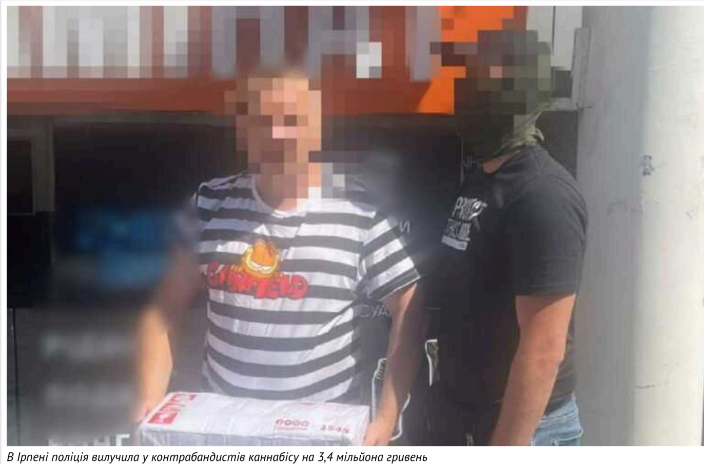
В Ірпені поліція вилучила у контрабандистів каннабісу на 3,4 мільйона гривень

За процесуального керівництва Київської обласної прокуратури в Ірпені викрито групу осіб, яка налагодила незаконне переміщення каннабісу з Королівства Таїланд до України під виглядом «тайського чаю». Наразі двом особам повідомлено про підозру в контрабанді наркотичного засобу на понад 3,4 млн гривень.