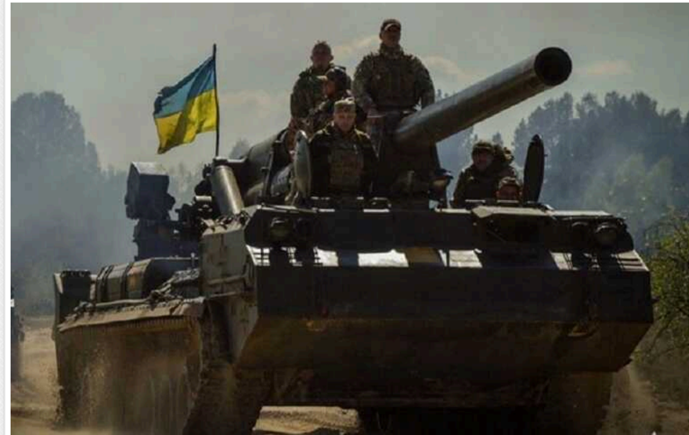
Financial Times: ЗС РФ на кордоні Курської області спокійно пили каву в лісі, коли їх атакували ЗСУ

Financial Times пише, що російські війська на кордоні Курської області спокійно пили каву в лісі, коли їх атакували ЗСУ.