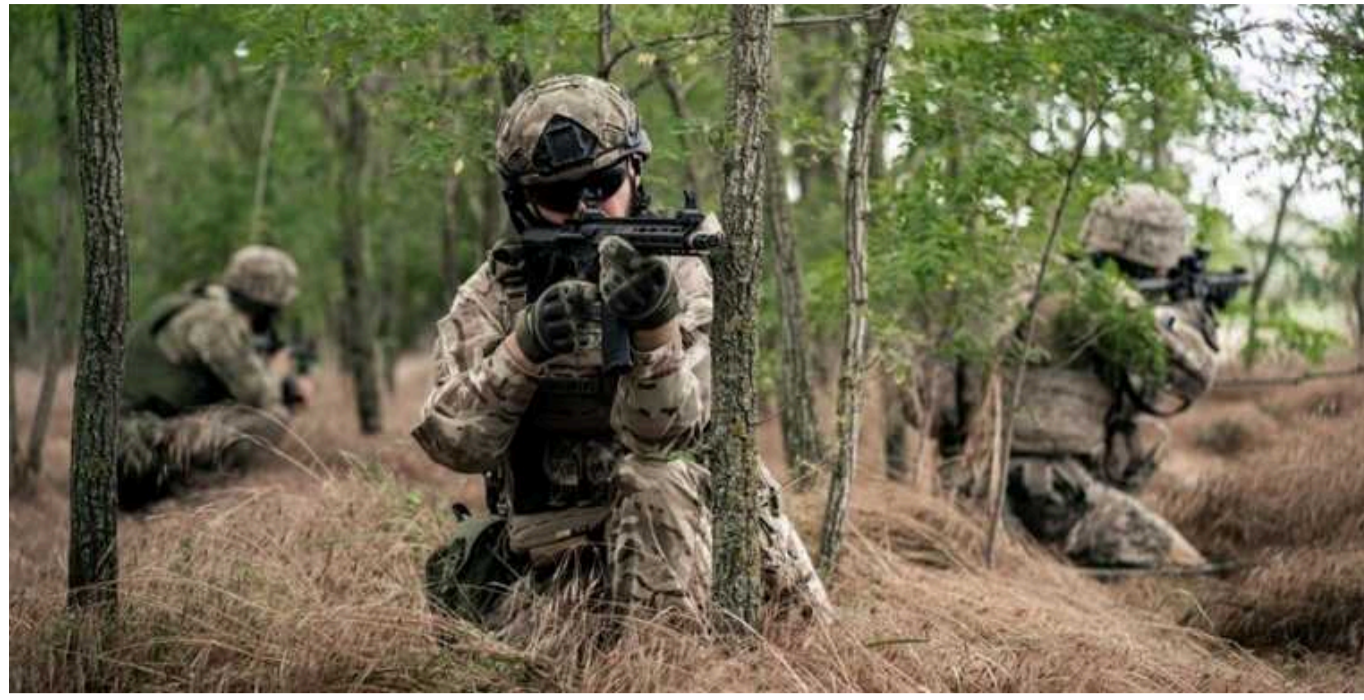
Bild: Атака на Курську область шокувала Путіна, Україна хоче "дестабілізувати" Росію

У Курській області вже кілька днів поспіль панує хаос.