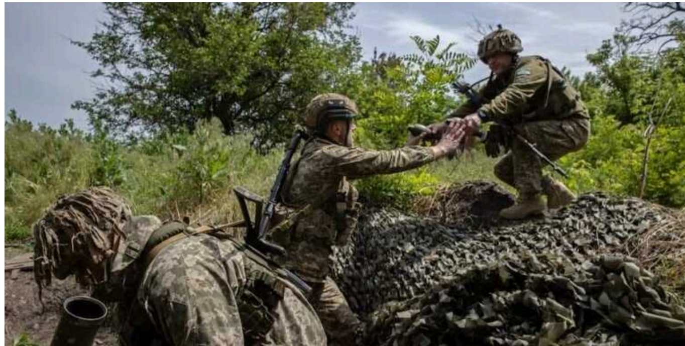
У ЗСУ розповіли про ситуацію біля Торцецька: окупанти задіяли свіжі резерви