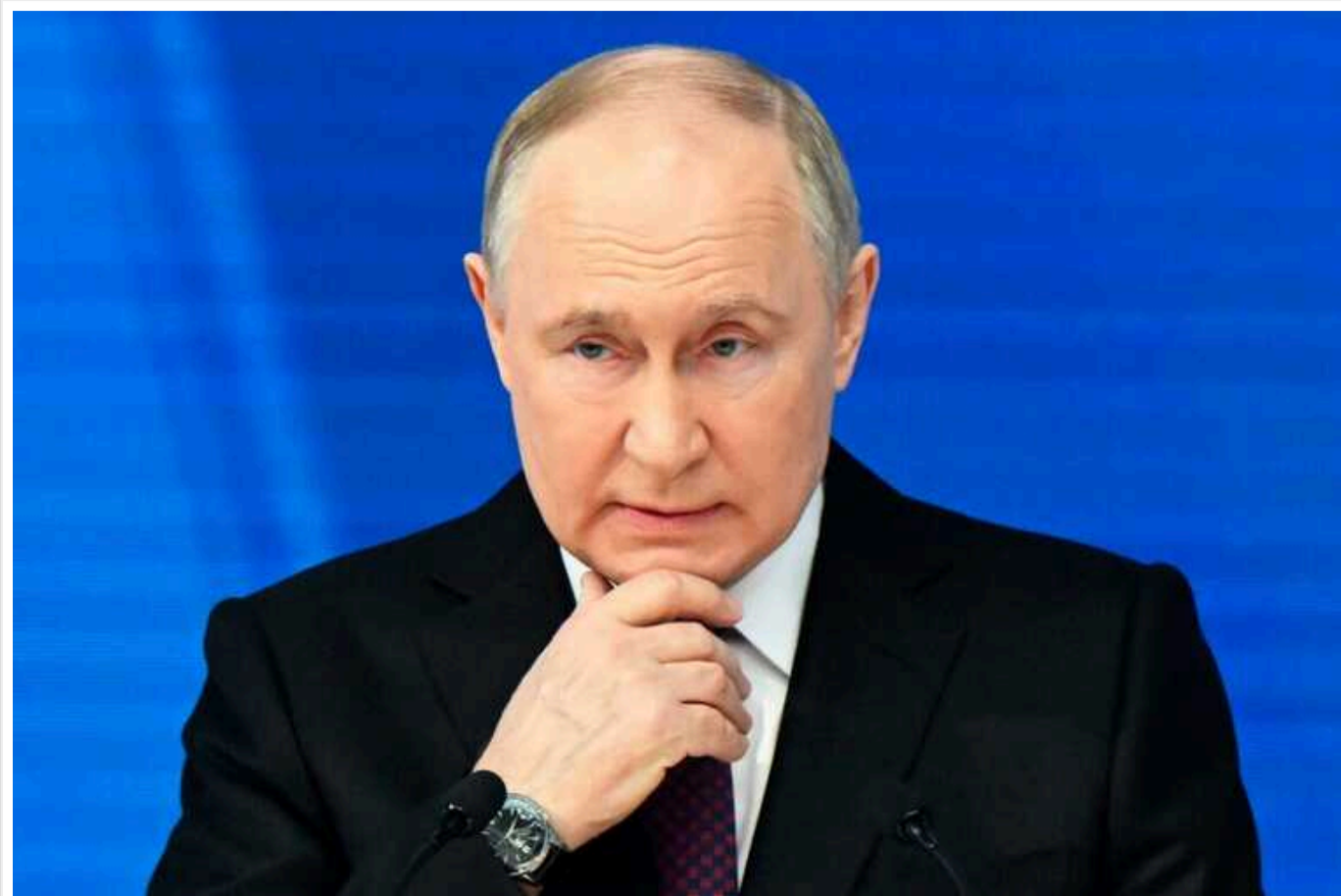
Російський диктатор Путін провів нараду щодо кордону з Україною та наказав "витиснути противника" з РФ

Російський диктатор Володимир Путін майже через тиждень після початку боїв у Курській області скликає ще одну нараду щодо ситуації на кордоні з Україною.