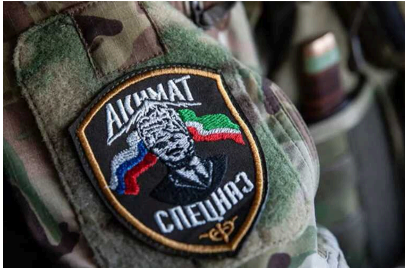
Українські військові взяли в полон кадірівця в худі майже за 100 тисяч гривень

Відео з полоненими ЗС РФ з'явилося в соцмережах. Й уважні коментатори помітили на військовослужбовці з "Ахмат" дуже дорогий одяг.