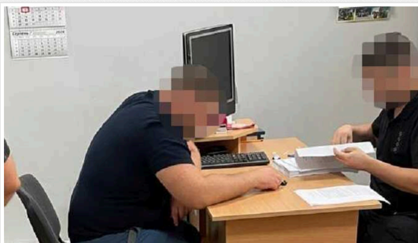
ДБР: Для армії закупили неякісні аптечки на десятки мільйонів

Ексначальнику одного з військових навчальних центрів, начальнику медичної служби цього центру та вісьмом приватним підприємцям повідомили про підозру за фактом постачання неякісних аптечек для ЗСУ.