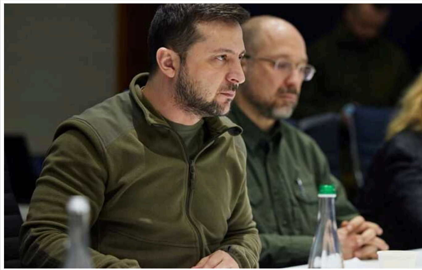
Зеленський вже ухвалив рішення про заміну прем'єра Шмигала на Свириденко, - нардеп

У липні Володимир Зеленський вже ухвалив рішення про заміну прем'єра Шмигала на Свириденко.